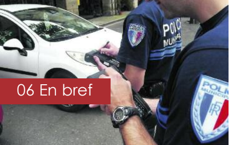
06 En bref